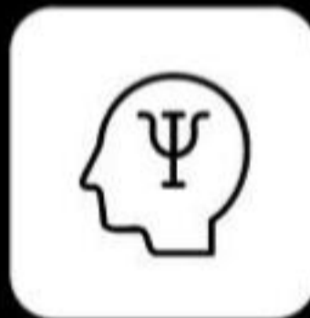
Programa de atención médica