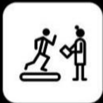
Programa de condicionamiento físico