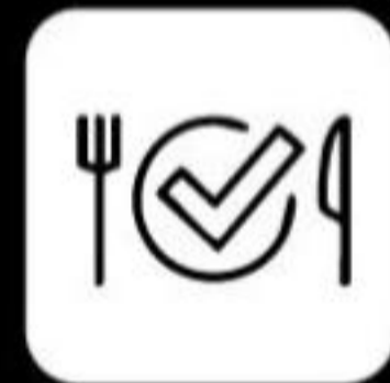
Programa de nutrición virtual