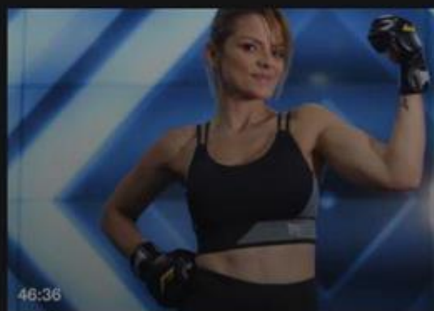
45 min | Entrenamiento de combate | Vic...