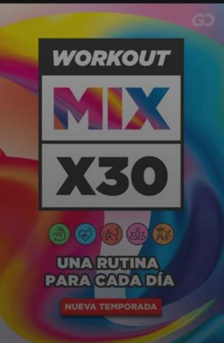
Workout MIX-X30 1 temporada