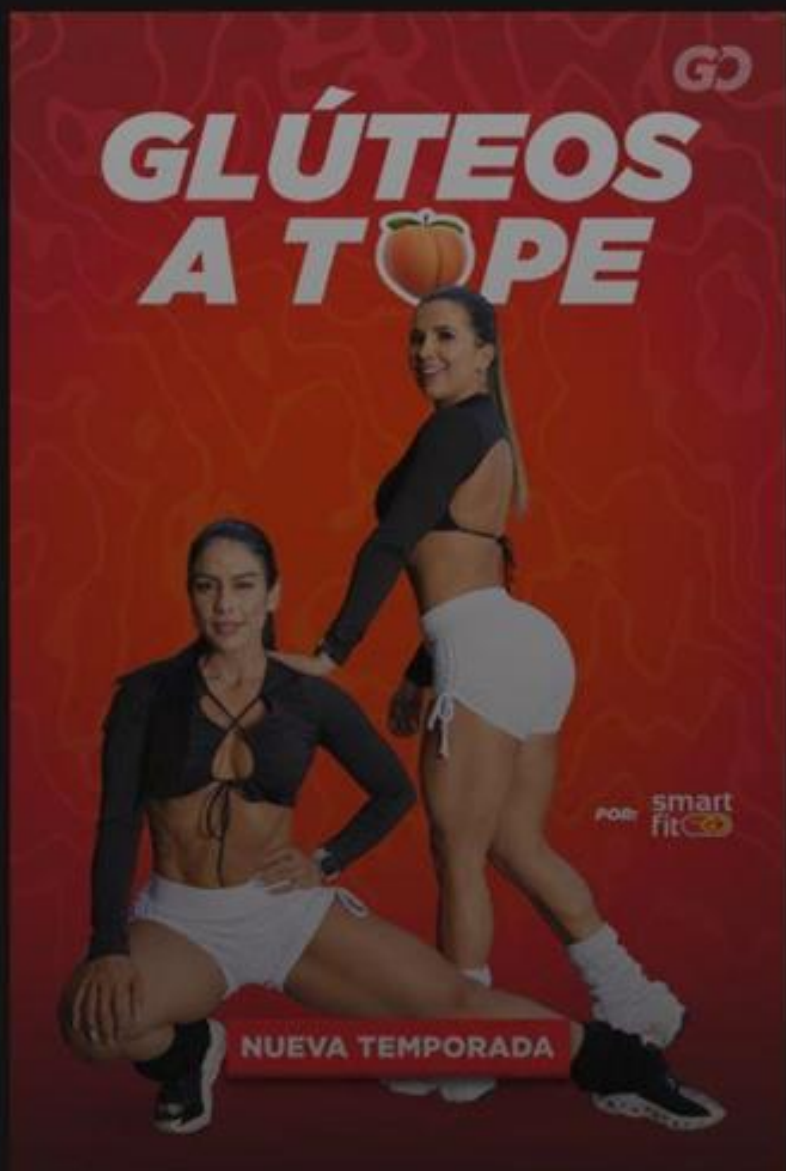
GLÚTEOS A T🍑PE 1 temporada